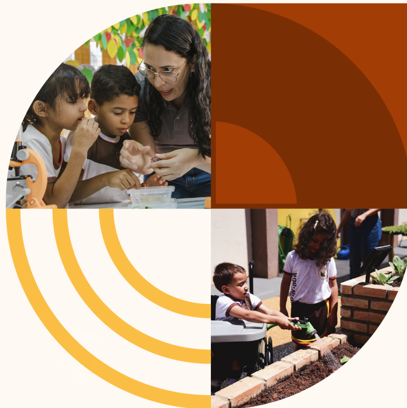
Escola Municipal Professora Ediene da Silva Dias, em Ouvidor (GO).

Além disso, o programa abrange a qualificação da equipe pedagógica para realizar as ações de incremento à leitura e os projetos didáticos ligados à alimentação saudável e sustentável. Preparando este público para abordar a pauta junto aos alunos, professores, funcionários e familiares.