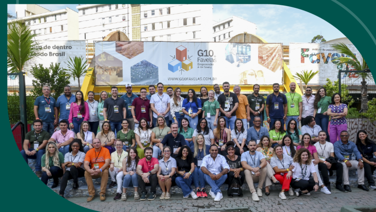
Encontro anual de voluntários 2023, em Paraisópolis, no G10 Favelas (SP).

Dia mundial da alimentação, doação de sangue, ações de inclusão social