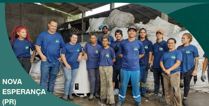
NOVA ESPERANÇA (PR)

Acelerando o desenvolvimento da COORECA (SP)